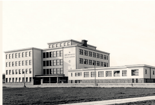
Sonja Lapajne Oblak (Ljubljana, 1906–1995)