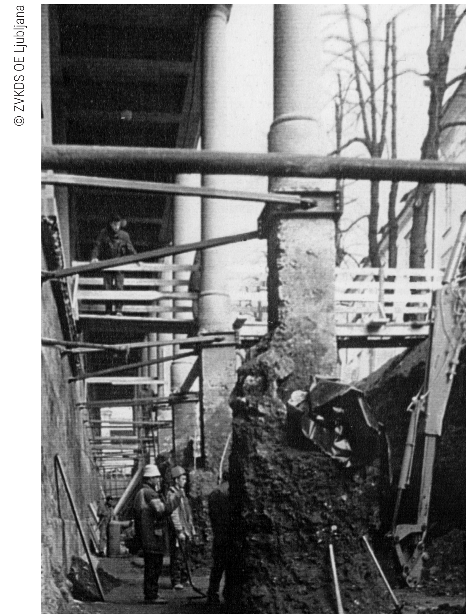
Ljubljana, Plečnikove tržnice, 1995

Izmere objektov na terenu in večina prostoročnega risanja so bile najboljše osnova in delovna podlaga za pripravo tehničnega dela konservatorskega programa za prenovo. Pristen stik z objektom in materiali je pomenil dobro načrtovanje posegov in uspešen nadzor nad deli.