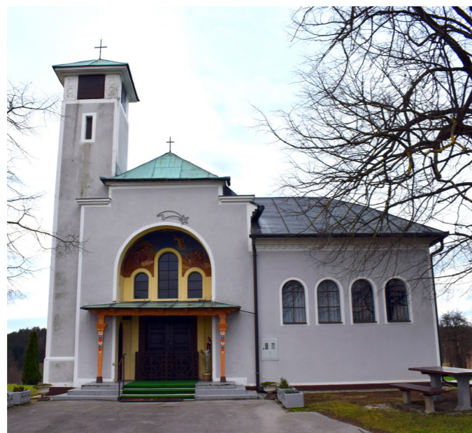
Kapela Presvetega Srca Jezusovega v Žabljeku.