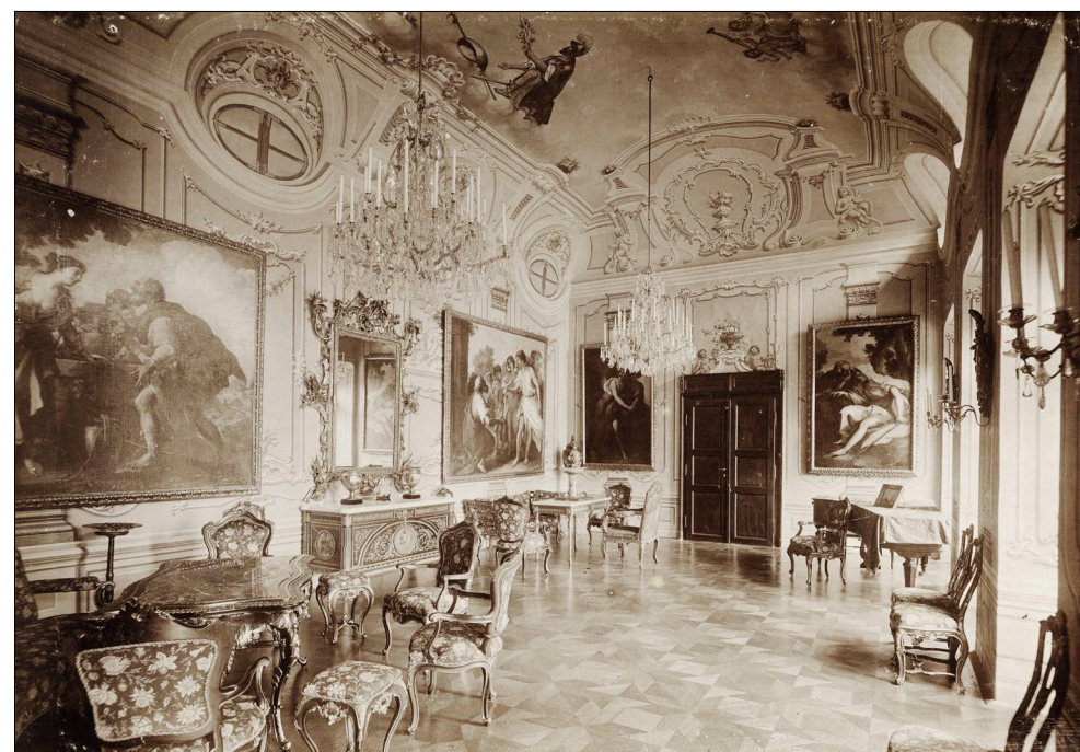
2.–3. Veliki salon v gradu Murska Sobota, po 1898