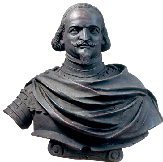
1. Beneški kipar 17. stoletja: Doprni portret vojaškega poveljnika, Pomurski muzej, Murska Sobota