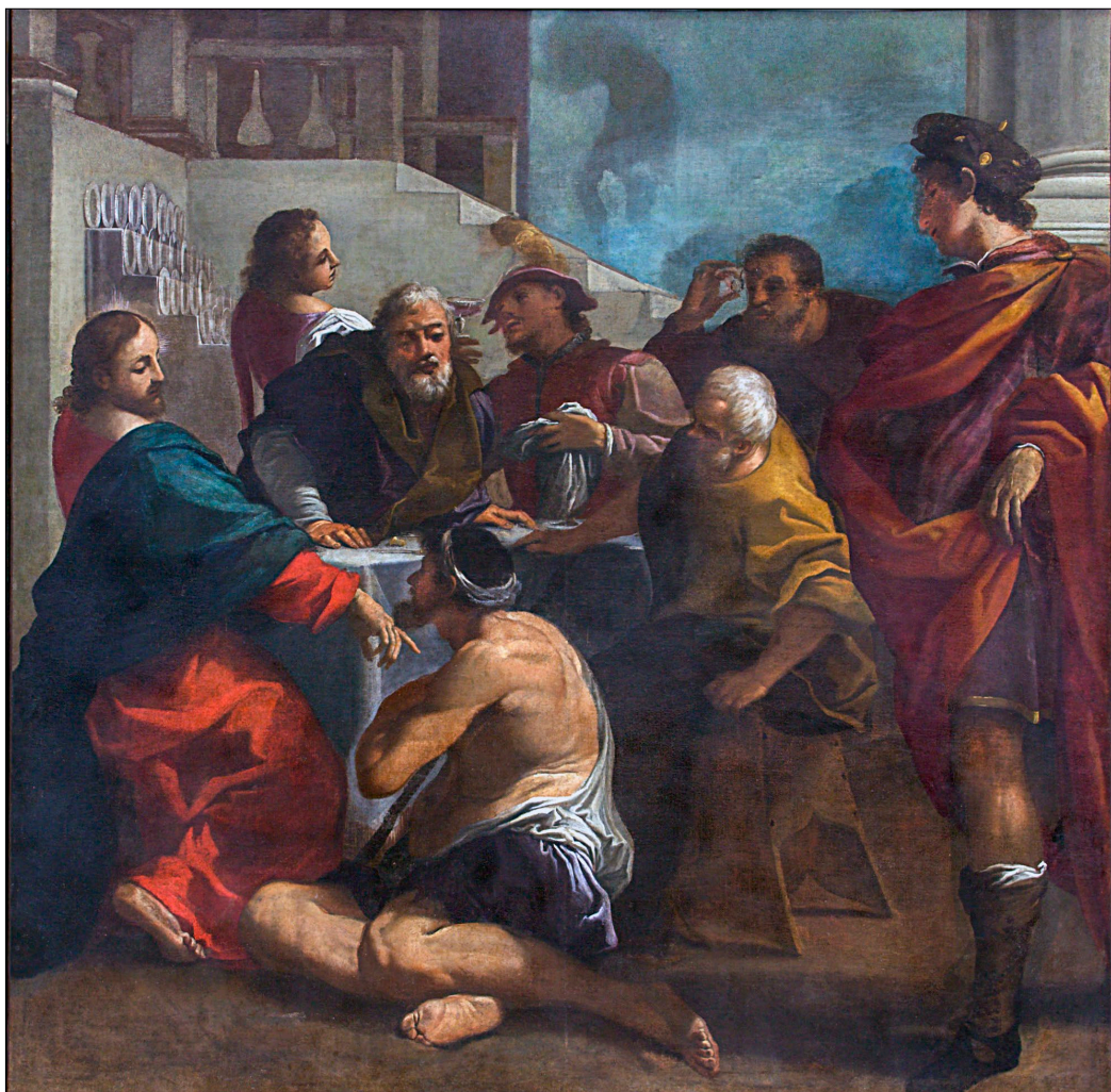
4. Italijanski slikar 17. stoletja: Jezus ozdravi hromege , Pomurski muzej, Murska Sobota

v gradu Murska Sobota, lahko primerjamo z dvema izjemnima okvirjema portretov iz palače Morosini, ki ju je prav tako kupil grof Szapáry in ki so ju pozneje hranili v Budimpešti. 44