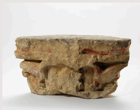
Eden od redkih stavbnih členov, ohranjenih iz srednjeveške križevniške cerkve v Ljubljani. Gre za kapitel, na katerem sta še vidna dva zmaja, obrnjena eden proti drugemu.

V predavanju bodo analizirani pisni in vizualni viri, ki so v pomoč pri rekonstrukciji srednjeveške cerkve nemškega viteškega reda v Ljubljani, na mestu katere danes stoji monumentalna baročna centralna arhitektura. Predstavljena bo hipoteza o prvotnem tlorisu in izgledu križevniške cerkve in njenih srednjeveških stavbnih fazah. V nadaljevanju bomo odgovorili na vprašanje, kakšna arhitektura je bila v srednjem veku značilna za cerkve nemškega viteškega reda in kakšno mesto v tej skupini pripada ljubljanski cerkvi. V zadnjem delu predavanja se bomo osredotočili na evropske zglede, ki bi bili lahko odločilni za zasnovo srednjeveške križevniške cerkve. Posebna pozornost bo pri tem posvečena vprašanju, kakšno vlogo so pri stavbni zasnovi imele dinastične in politične povezave koroškega vojvode Ulrika III. Spanheimskega, graditelja ljubljanske cerkve. Predstavljena bo tudi njena funkcija pri širjenju češčenja izjemno vplivne evropske svetnice sv. Elizabete Ogrske/Turingijske.