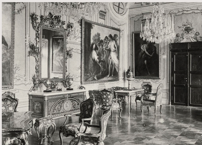
Veliki salon v murskosoboškem gradu na fotografiji iz let 1895–1899