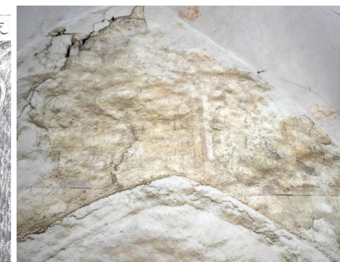
Freska v zahodni empori

empore, delno odkrite slikarije iz zadnje četrtine 13. stoletja. Odkriti fragmenti bi lahko predstavljali prizor Marijine smrti. V ta čas se postavlja tudi zahodni samostanski trakt. Dvoriščna fasada trakta je imela na sredi do obnovitvenih del v prvih letih 21. stoletja stopniščni rizalit. Takrat so bile odkrite štiri zazidane šilaste ločne odprtine v pritličju, ki so jih prezentirali. O času nastanka v 13. stoletju priča tudi večje število okenskih odprtin na vzhodni in zahodni steni trakta.