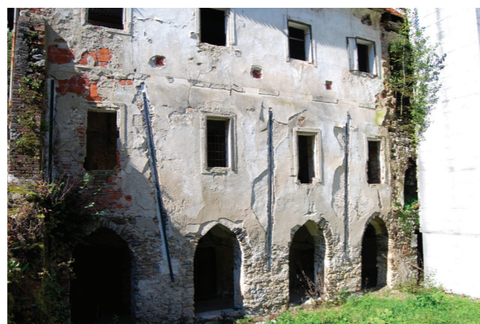
Dvoriščna stran zahodnega samostanskega trakta

Na Vischerjevi grafiki, ki nam kaže pogled na grad in samostan s cerkvijo, vidimo, da je bil samostanski kompleks nekoč mogočnejši. Danes precej okrnjen kompleks je omejen z obzidjem in zgradbami, ki ga zamejujejo: z zahodno stranico se razteza ob Toplem potoku, na severu ga omejujeta upravno poslopje na severozahodnem vogalu in župnišče na severovzhodnem vogalu (na mestu nekdanjega obrambnega stolpa). Na vzhodu je kompleks zamejen z obzidjem, na jugu pa se zaključuje z ograjenim nunskim pokopališčem.