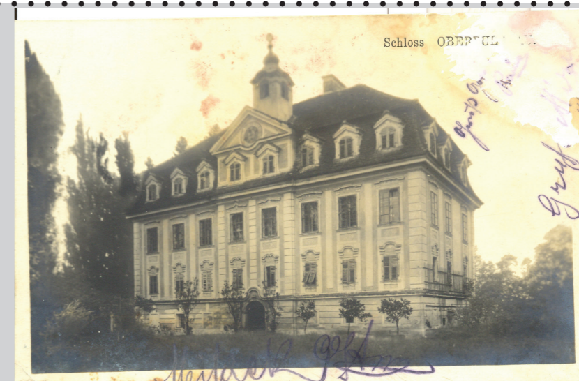
Razglednica Zgornje Poljskave leta 1911